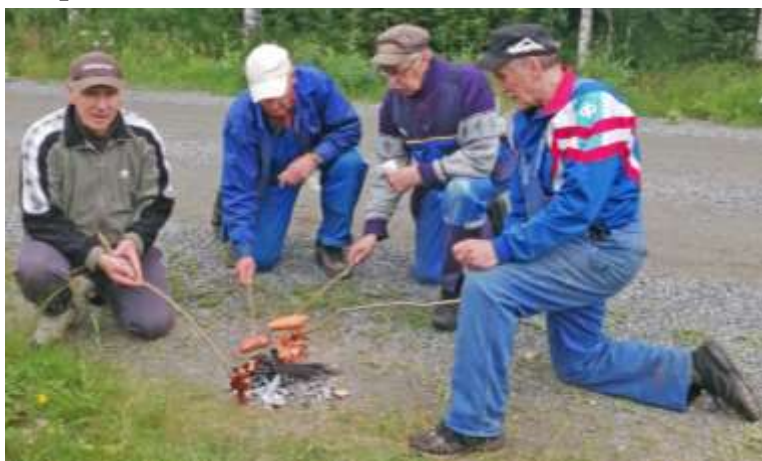
Välillä paistettiin pienellä tulella Rintalantien varressa perinteiset makkarat.