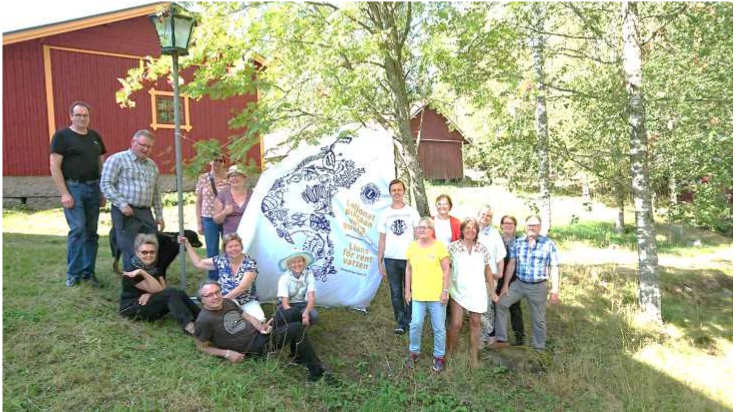
Lions Water Camp viikonlopulta elokuussa. Kuvassa ympäristöaktiiveja ympäri Suomen. Kuva Mika Pirttivaara

Ympäristöasioissa me jokainen voimme miettiä millaisilla pienillä arjen teoilla voisimme vähentää elintilamme saastumista. Ei niiden asioiden tarvitse olla mitään mahtipontisia, sillä jos moni tekee pienenkin parannuksen voi yhteisvaikutus olla suuri.