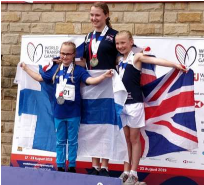
Track & Field Ball Throw Female 9 to 11