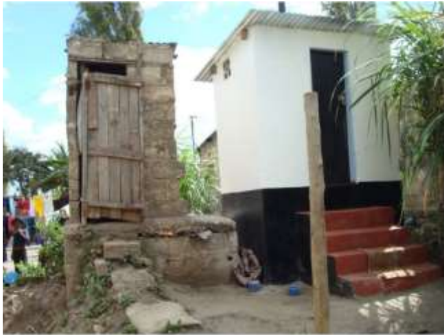
Koulun vanha ja uusi käymälä.

Unicef on laskenut, että yksikin lisävuosi keskiasteen koulutusta voi kasvattaa naisten tuloja 15%. Uusimmat tutkimukset kertovat myös, että tyttöjen koulutus hillitsee merkittävästi ilmastonmuutosta. Planin tänä vuonna julkaisemien tutkimusten mukaan jokainen tyttöjen koulussa viettämä vuosi parantaa myös valtion kykyä sopeutua ilmastonmuutokseen. Asia selittyy tyttöjen taitojen ja tietojen lisääntymisellä ja tasa-arvon edistymisellä. Tyttöjen pysyminen koulussa on myös tehokkain tapa ehkäistä väestönkasvua. Yksi yleisimmistä syistä tyttöjen koulunkäynnin keskeyttämiseksi on vessojen vähäisyys, täydellinen puuttuminen tai yhteiset vessat poikien kanssa. Saharan eteläpuolisessa Afrikassa yli puolet koulun keskeyttäneistä tytöistä sanoo keskeyttämisen syyksi sen, että koulussa on surkeat vessat tai ne puuttuvat kokonaan.